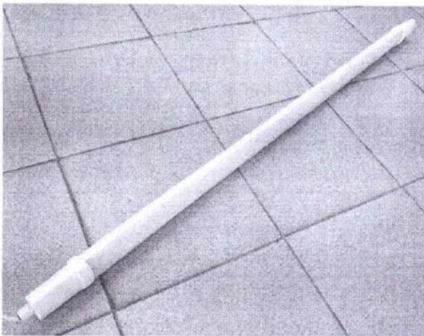
Внешний вид светильника

Изделие: Светодиодный светильник модель: SPP-3 артикул: SPP-3-40-6K-M Номер образца: 331/21 Заявитель: ООО "Орион" Адрес заявителя: 143005, Московская область, город Одинцово, Можайское шоссе, дом 806, 2 этаж, комната 2136 Изготовитель: АТЛ Бизнес (Шэньчжэнь) КО., ЛТД Адрес изготовителя: КНР, 518054, Шэньчжэнь, Наньшань Дистрикт, Чуанье стрит, Нос Баоличэн Билдинг, рум 901 Тип источника света: Светодиоды