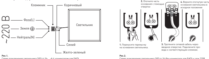
Рис.1. Схема подключения светильника SPO-6-36...-А (с коннектором для БАП). SPO-6-48 и SPO-6-72 к сети 220В.

3.3.1. Для подключения светильника необходимо подвести к месту его монтажа 3-х жильный провод. 3.3.2. Этот провод необходимо подключить к проводу источника питания с помощью внешнего клеммника (в комплект не входит) в соответствии со схемой, изображенной на рис.1, модель SPO-6-36 не имеет вывода проводов, подключение происходит через клеммную колодку в соответствии со схемой на рис. 2.