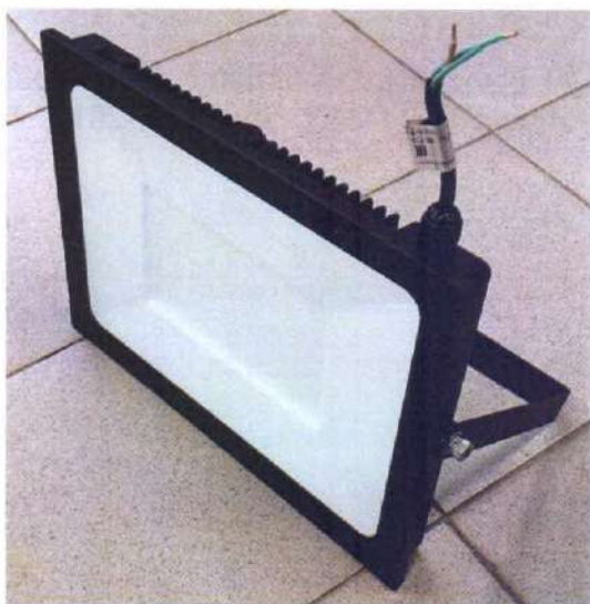
Внешний вид прожектора